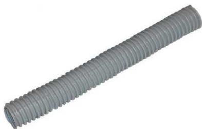
Tube ondulé type DD 20x25 ou DD15x20

Cette vanne peut être fixée au tube ondulé diam. 20 mm type DD15x20.