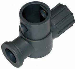
Vanne type DD-3050-A