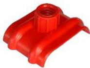
Chapeau d'évent type DD 1050HF pour gaines plates

DD 1060HF pour tube ondulé DD20x25 mm . DD 1050HF pour tube ondulé DD15x20 mm .