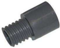
Connecteur type DD-1017-A