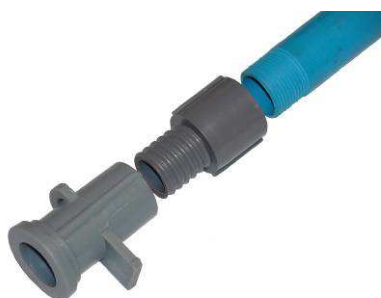
Vannes type DD-1003-A raccordées avec tubes de ¾" type DD-6009