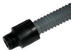
Connecteur type DD-1033-B 1/2" tube ondulé DD15x20 mm.