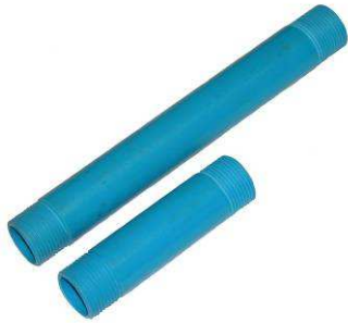
Tube rigide en PVC type DD-6010 et DD-6009