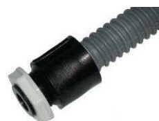
Connecteur type DD-1033-B 1/2" tube ondulé DD15x20 mm et écrou d'arrêt DD-8000

Écrous d'arrêt pour connecteurs filetés :