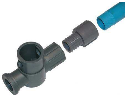
Vannes type DD-3050-A raccordées avec tubes de ¾" type DD-6009