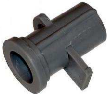
Vanne type DD-1003-A

Cette vanne, qui permet l'arrêt du mélange, peut être fixée directement au tube ondulé DD20x25 diam. 25 mm et réutilisée après graissage de la partie conique de fermeture.