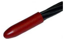
Pointe type DD-2015-PU

Les pointes DD-2015-PU ont été étudiées pour protéger la gaine ondulée contre les incisions causées par le frottement du toron pendant l'enfilage et faciliter l'entrée des torons dans les gaines. Elles peuvent être utilisées sur les torons T15, T15S et T15C et sont réutilisables.