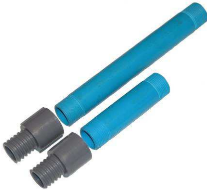
Tube rigide en PVC type DD-6010 et DD-6009 avec raccord type DD-1017-A.