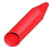
Pointe type DD-2115-PF

Les pointes DD-2115-PF ont été étudiées pour la gestion de torons coupés sur mesure sur les bancs de coupe. Elles peuvent être utilisées sur les torons T15, T15S et T15C et sont réutilisables.