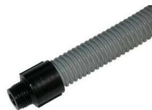
Connecteur type DD-1034-B 1/2" tube ondulé DD 20x25 mm.