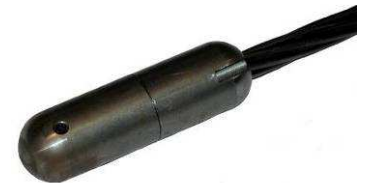
Pointes type TT-5077

Les pointes TT-5077 ont été étudiées pour des enfilages importants et sont en acier et équipés de blocage par étai T15. Elles sont conseillées dans tous les cas où les enfilages résultent importants et où les pointes en plastique se cassent à cause des aspérités du positionnement des gaines, il faut utiliser des pointes type TT-5077 qui offrent une résistance majeure aux chocs.