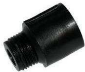
Connecteur type DD-1033-B et DD-1034-B