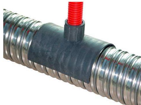
Chapeau d'évent type DD-1001 installé sur gaine métallique

Chapeaux d'évent pour gaines plates type SPE-78x25x2 mm :