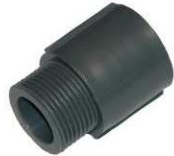
Connecteur type DD-1017-B