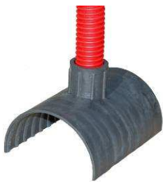
Chapeau d'évent type DD-1001

Chapeau d'évent pour câbles multitoron type DD 1001 .