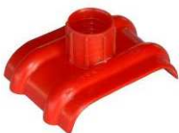
Chapeau d'évent type DD 1060HF pour gaines plates