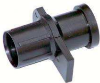
Vanne type DD-1016-A

Cette vanne permet l'arrêt du mélange et peut être fixée directement au tube ondulé DD20x25 et réutilisée généralement pour la fermeture des tubes d'évent.